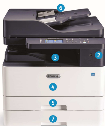
Imprimanta multifuncțională Xerox® B1025

Configurația DADF ilustrată cu tavă suplimentară opțională.