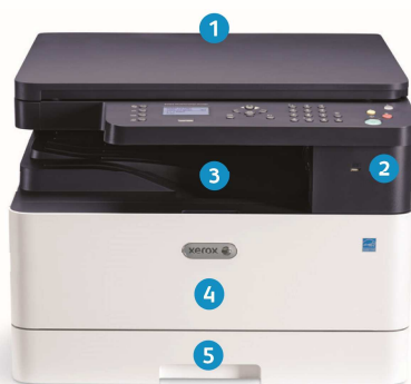
Imprimanta multifuncțională Xerox® B1022

9 Xerox® B1025 dispune de o interfață cu ecran senzorial color de 4,3 inch pentru un plus de simplitate.