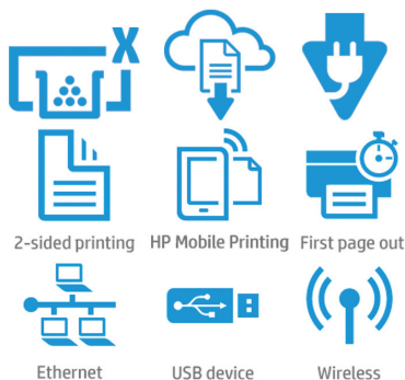
2-sided printing HP Mobile Printing First page out